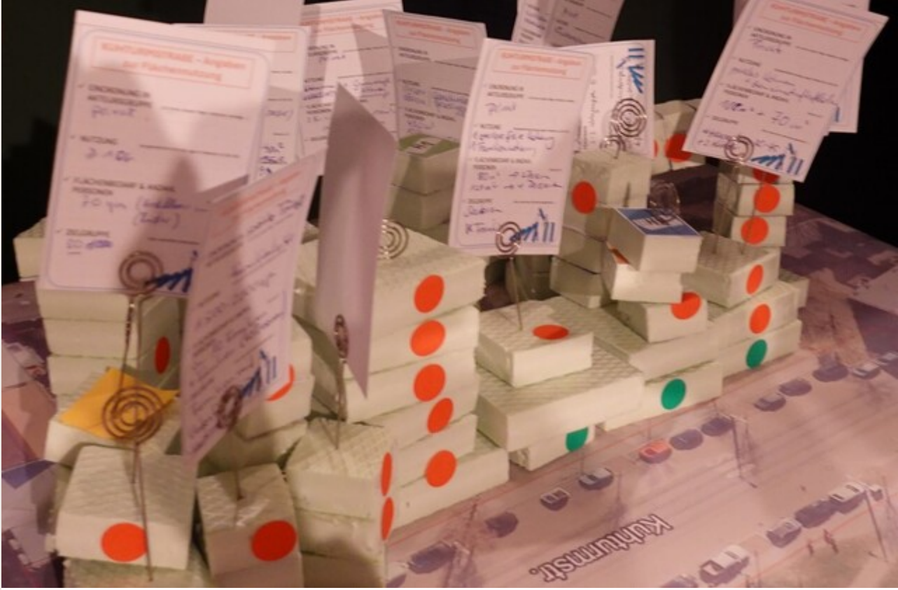
© Tanja Korzer: Ideen und Bedarfe für die Bebauung an der Kultureturmstraße