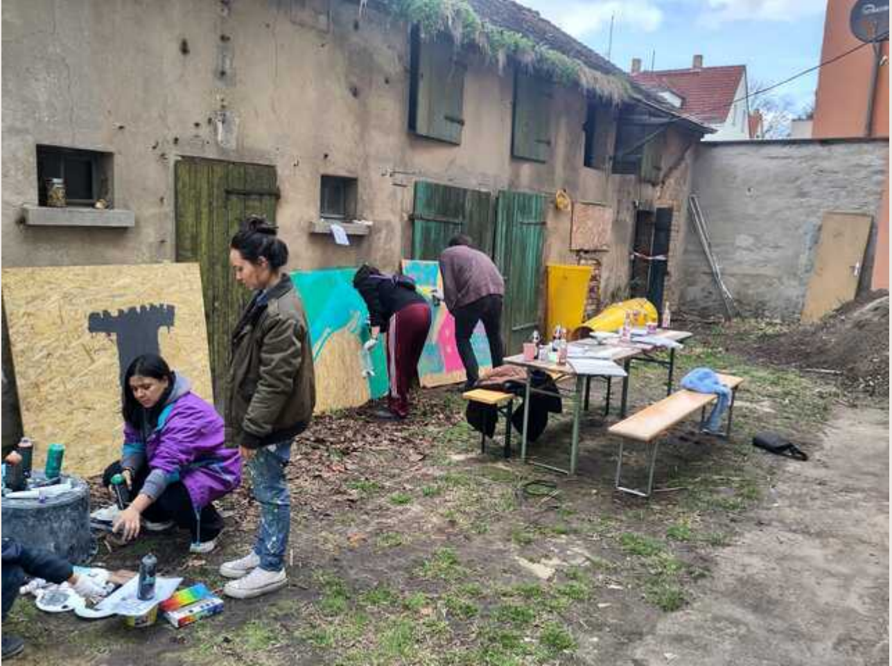
Graffitiworkshop Sternschuppen Haus- und Wohn GmbH in der Sternenstraße