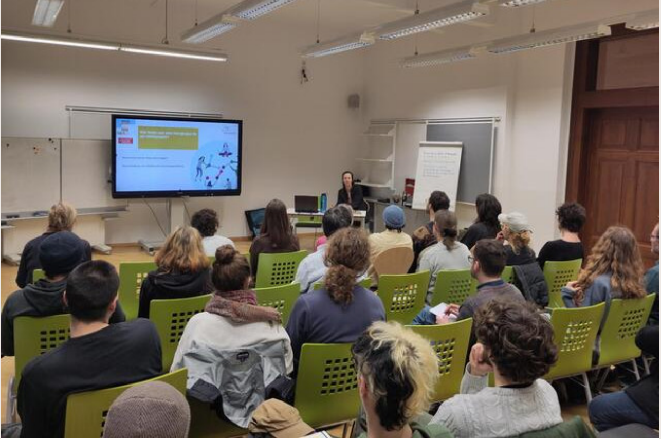
Einführungsveranstaltung: Wohnprojekte in Leipzig und in den Landkreisen