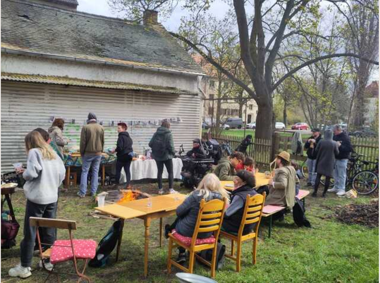
Kranfest Sternschuppen Haus- und Wohn GmbH in der Sternenstraße